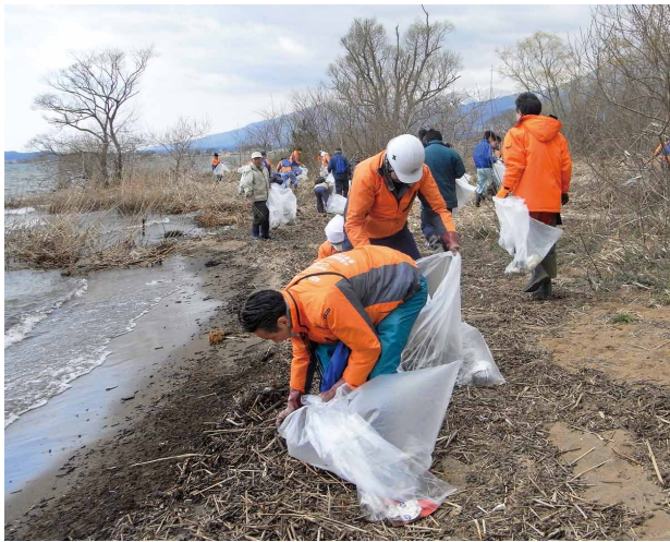
浜辺のヨシ屑を回収