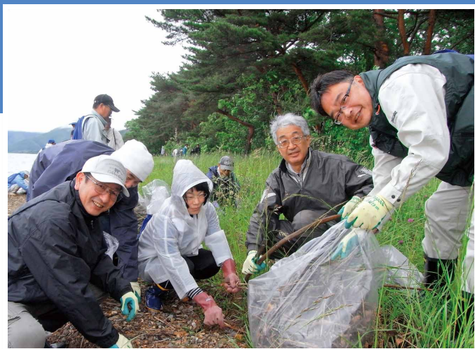
「猪苗代湖クリーンアクション 2014」参加者の皆さん (平成 26 年6月 14 日 猪苗代湖・舟津浜)