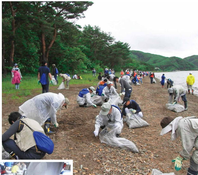
大勢の人に参加いただきました

舟津浜(郡山市湖南町)にて「猪苗代湖クリーンアクション2014」の第2弾を実施しました。猪苗代湖の東岸に位置する舟津浜は、西からの風の影響でヨシ屑などの漂着物が多く打ち上げられます。当日はヨシ屑を中心に約4・7トンのごみを回収しました。参加人数は、過去最高の約530名。職場や地域のグループ単位で参加された方がたくさんいらっしゃいました。