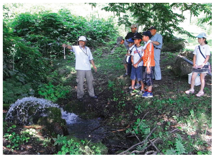
「親子で学ぶ猪苗代湖ものがたり」のようす (平成 26 年7月 26 日 磐梯山の湧水見学)