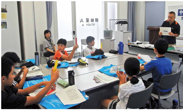
クイズで楽しく学習

午前中は、猪苗代町体験交流館「学びいな」で猪苗代湖について勉強しました。「NPO法人こどもの森ネットワーク」の橋口直幸先生が講師となり、クイズや実験を交えながら分かりやすく説明してください