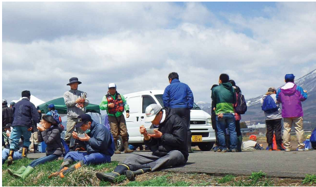
外で食べる豚汁は最高!

猪苗代湖北岸にてボランティアによる清掃活動「猪苗代湖クリーンアクション」を実施しました。春になり雪がとけると、冬の間に流れていたゴミやヨシ屑が姿を現します。そこで3班に分かれて、小黒川河口、白鳥浜、松橋浜、青浜の清掃を行い