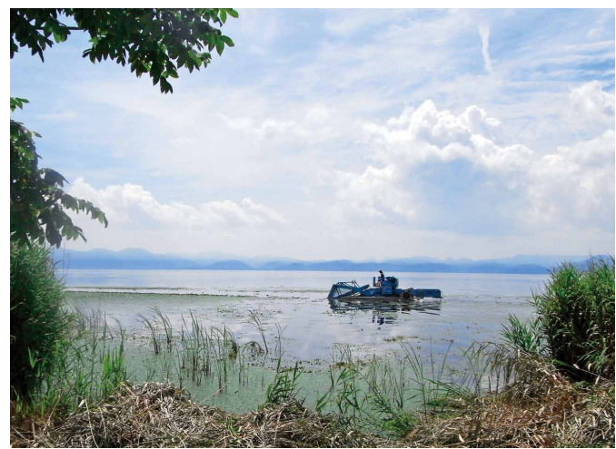
湖面を走るヒシ刈り取り船 (平成 26 年8月4日 猪苗代湖)