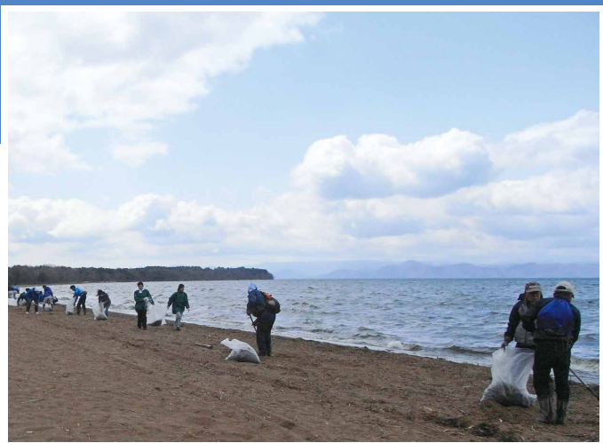
「猪苗代湖クリーンアクション 2014」のようす (平成 26 年4月 19 日 猪苗代湖・青浜)